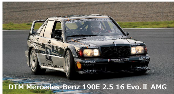
DTM Mercedes-Benz 190E 2.5 16 Evo. II AMG