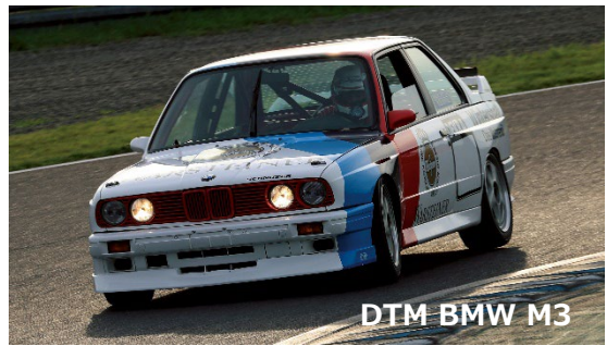
DTM BMW M3

その主役である「BMW M3 シュニツァー」、「メルセデス・ベンツ 190E 2.5 16 Evo.II AMG」、「Alfa Romeo 155 V6 Ti アルファ・コルセ」。3 台のワークスマシーンが同時に集まるのは、AUTOMOBILE COUNCIL 2022 だけ。この機会をどうぞお見逃しなく。