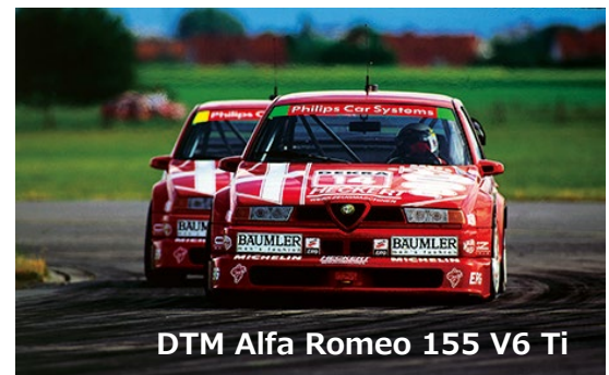
DTM Alfa Romeo 155 V6 Ti