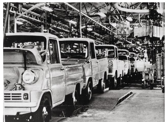
Honda 埼玉製作所でのT360生産模様

報道関係からの問い合わせ先 AUTOMOBILE COUNCIL 2023 広報事務局 Tel : 090-8940-1683 e-mail press@automobile-council.com